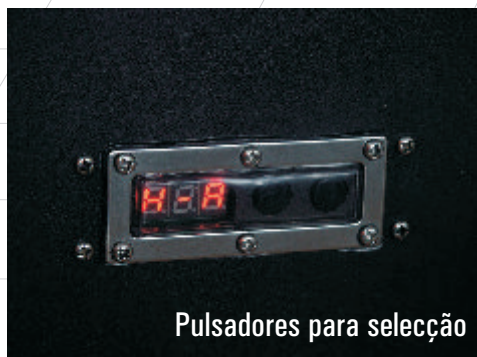
Pulsadores para selecção